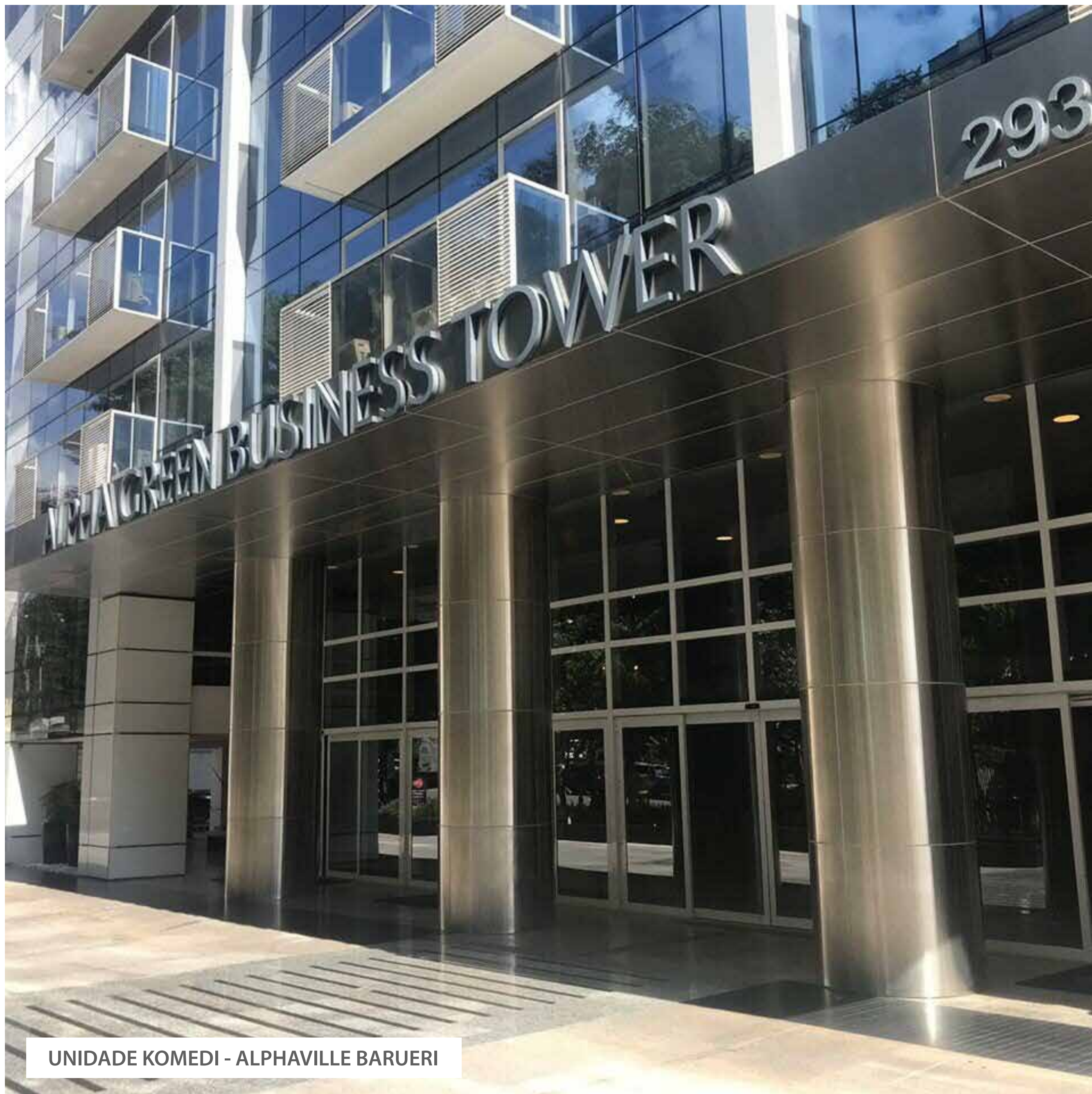
UNIDADE KOMEDI - ALPHAVILLE BARUERI